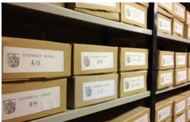
Blick ins Archivmagazin, wo die aussagekräftigen historischen Quellen aufbewahrt werden