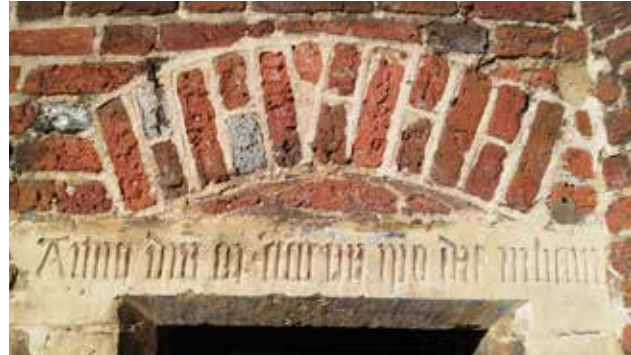
Originalquellen hinter geschichtsträchtigen Mauern: Die Eingangstür zum Stadtarchiv im Diebesturm, im Türsturz als lateinische Inschrift die Datumsangabe „Im Jahr des Herrn 1555 am Urbanstag“ (25. Mai)

Der Tag der Archive spiegelt damit die beiden wesentlichen Aufgaben des Stadtarchivs wider: Die Sammlung, Bewahrung und Bereitstellung von aussagekräftigen Schrift- und Bilddokumenten zur Stadtgeschichte und – auf dieser Basis – die Vergegenwärtigung von stadtgeschichtlichen Ereignissen und Entwicklungen, insbesondere wenn sie für unser Selbstverständnis und unsere eigene Gegenwart bedeutsam sind.